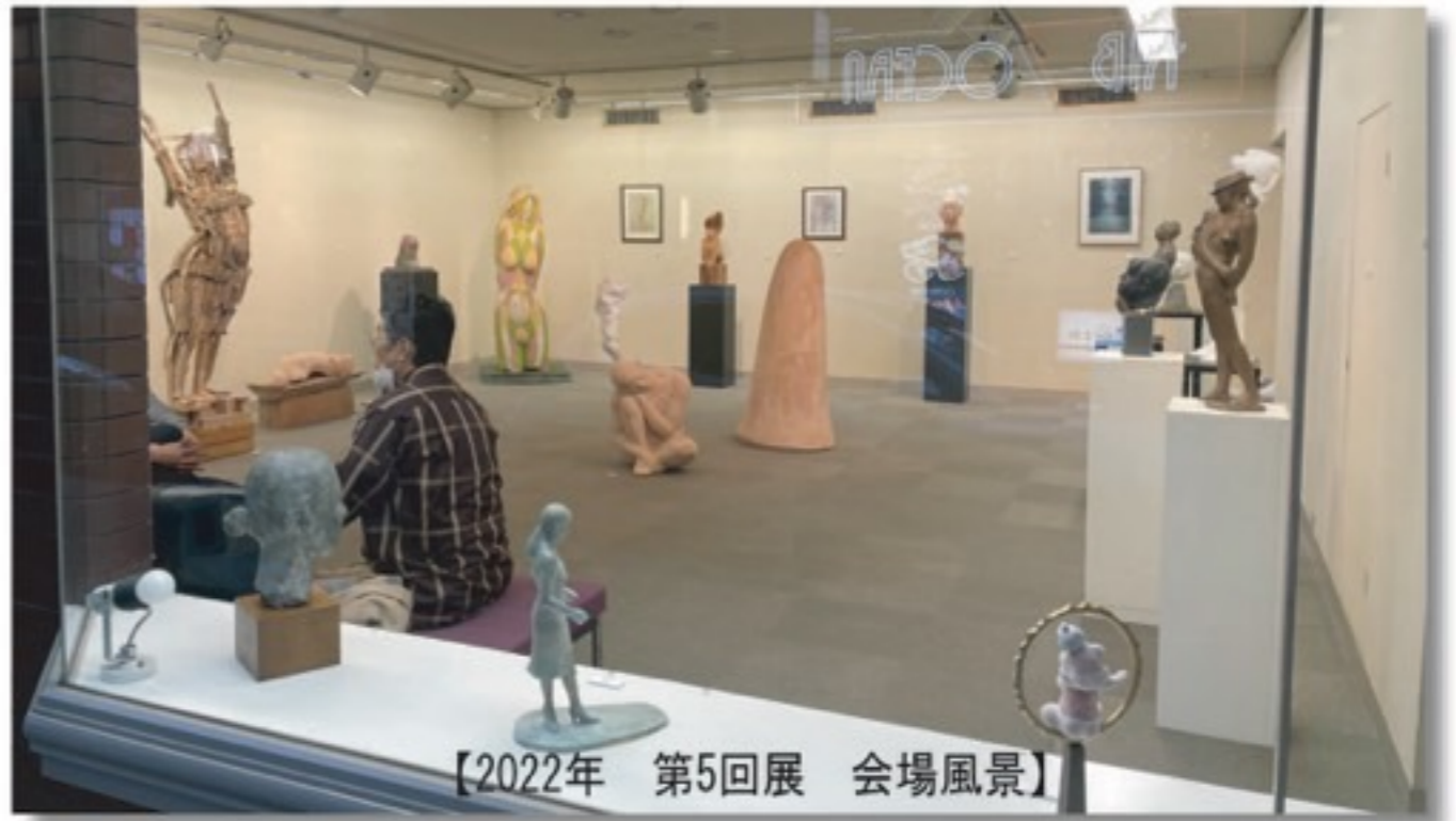
【2022年 第5回展 会場風景】